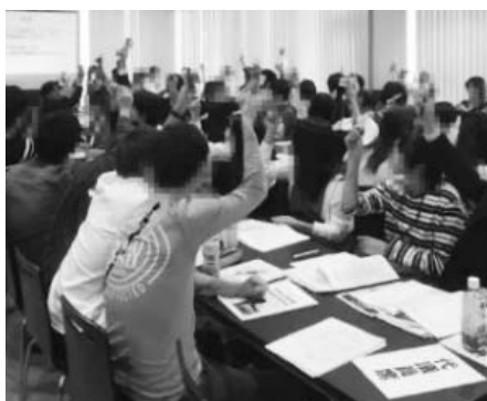
臨時総会のようす